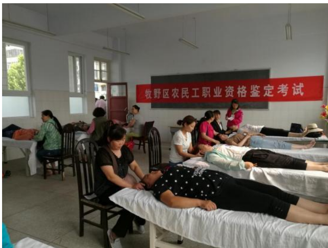
职业资格鉴定考试现场

学校积极发挥国家职业技能鉴定所服务功能。对本地区及周边地区开展11个工种的技能鉴定工作，2025年1500人。我校培训部还承载着中餐烹饪、特色小吃等培训服务，为本地区的特色餐饮研发、美食街建设和文明商业街的创建作出积极贡献。