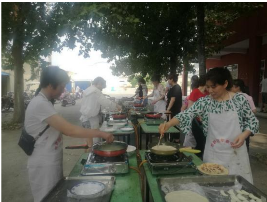
中餐烹饪、特色小吃培训现场

依托牧野区职业教育中职业技能等级认定中心，认真开展了职业技能等级认定工作。2025年职教中心230名学生参加了保育师、园艺生产技术员等培训，经过考核和实际操作，全部学生达到了职业技能等级要求和标准，并获得了相应的技能证书。2025年牧野区职业教育中心超额完成年度培训任务。