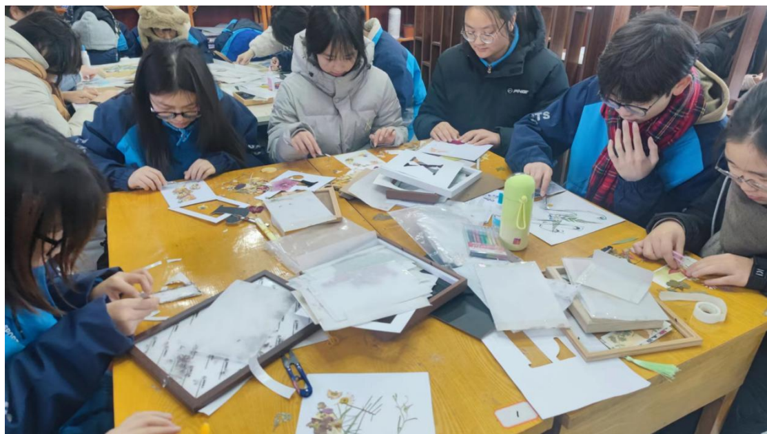
实操（压花制作装饰画）

100%，专业实践性教学课时均达到260个课时，保证了教学实习的效果。岗位实习总学时累计六个月。下一步学校将继续加大产教融合、校企合作工作力度，进一步更新办学理念，尤其是以专业建设为抓手，通过增加合作企业、强化校企合作，形成科学规范的校企联合培养人才机制。