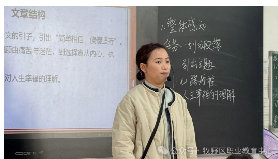
同课异构教师展示活动