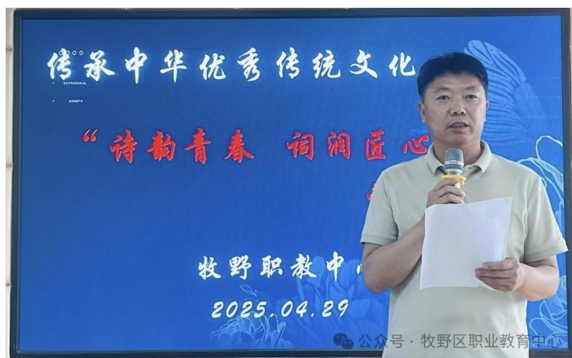
传承 中华优秀传统文化