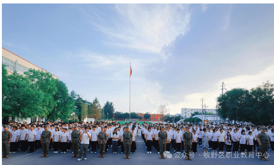
纪念九一八 爱国教育