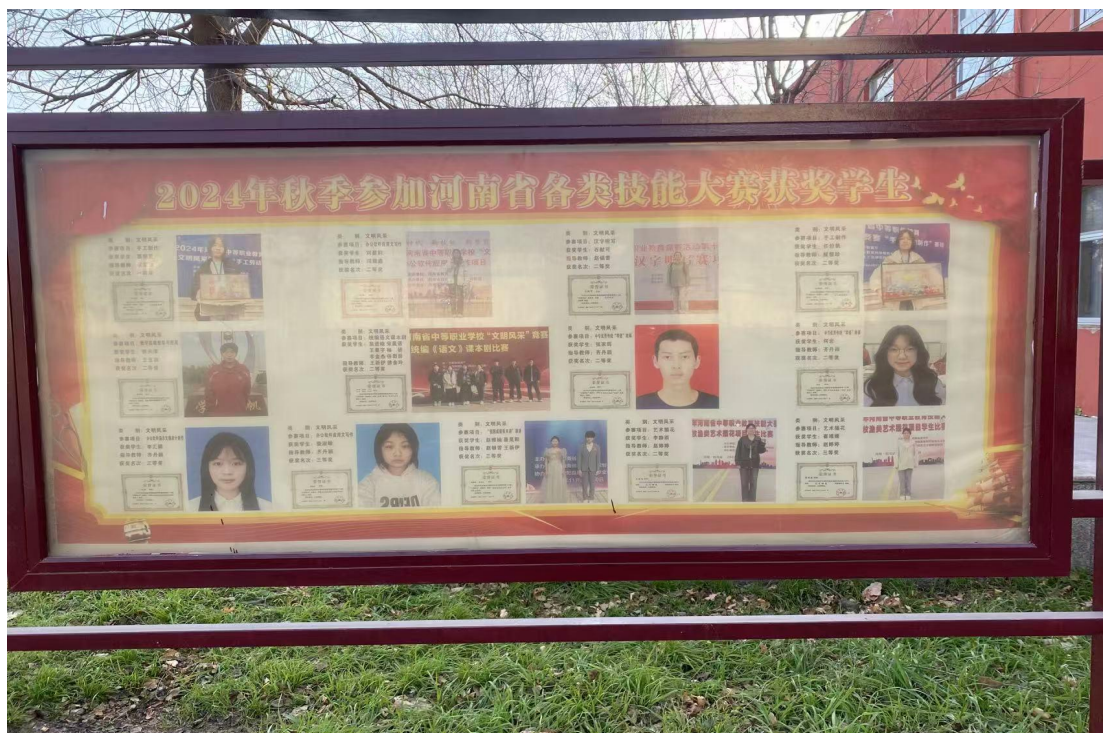
省级技能竞赛获奖展示栏