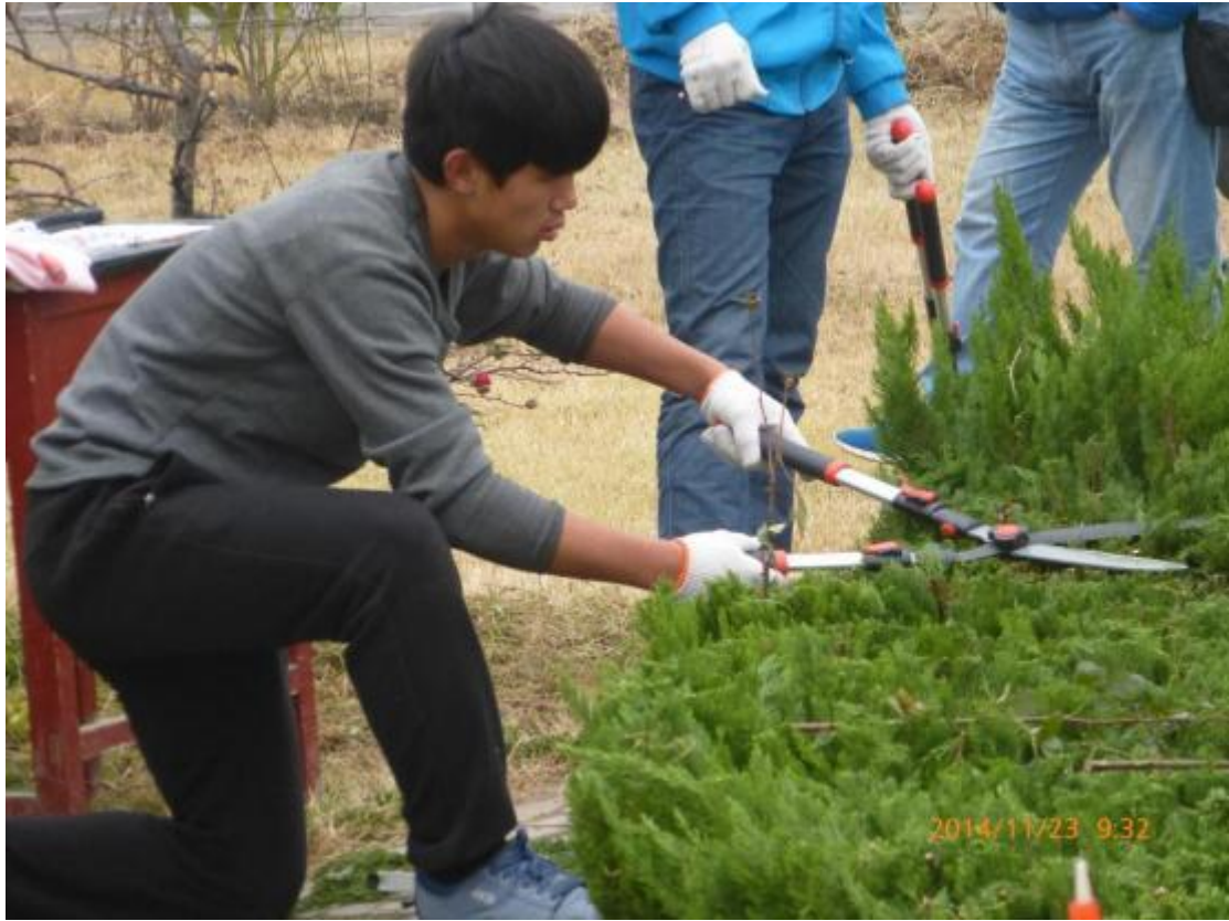
园艺生产技术员实操