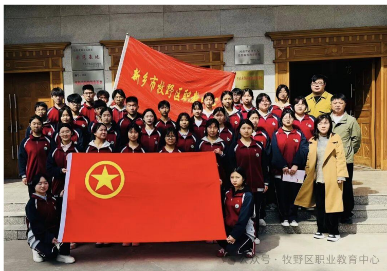
清明祭奠烈士 团员教育活动