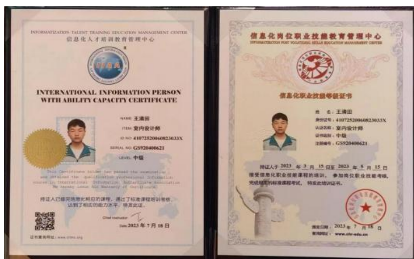
学生获得的企业等级证书