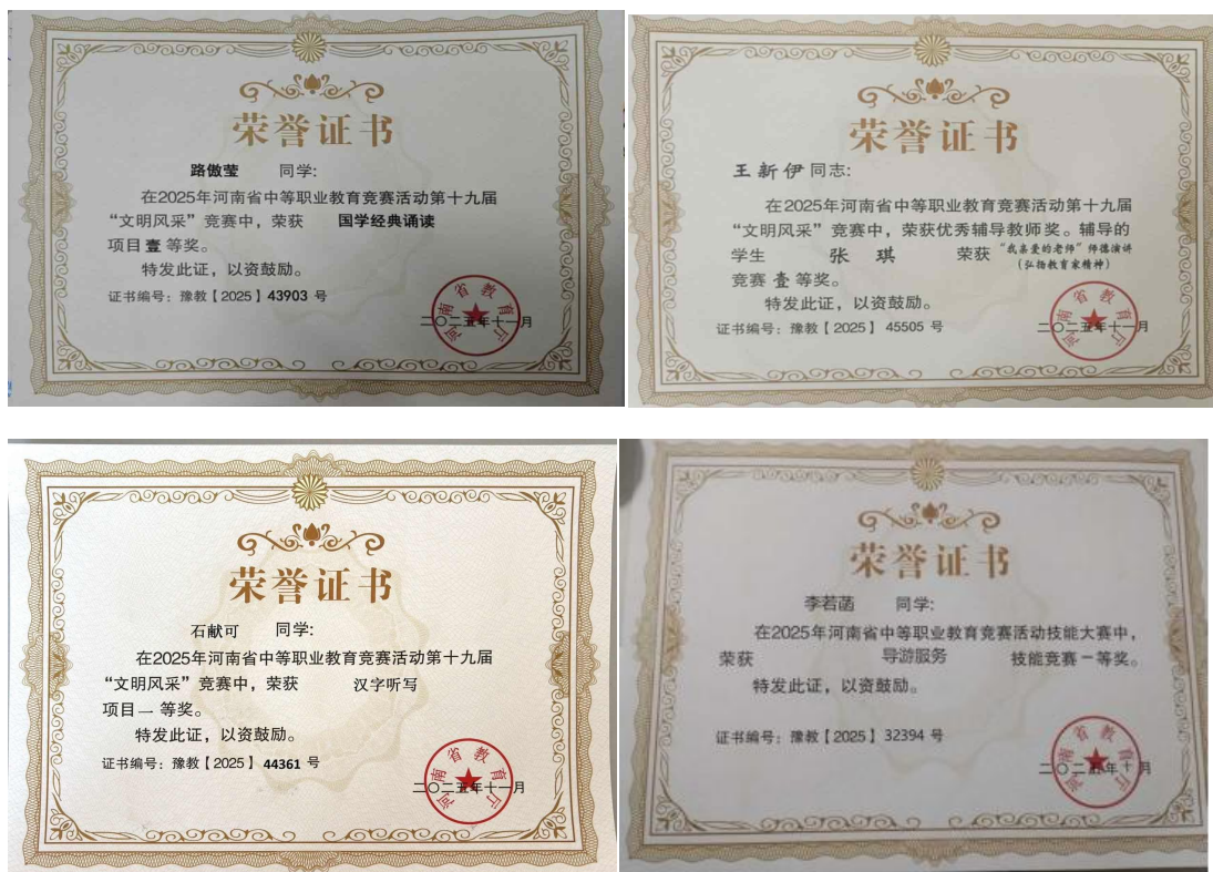
学生省赛获奖证书